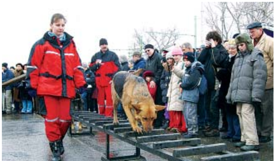
A zord idő ellenére sokan vettek részt a bemutatókon

A nyomozás során beazonosították a fedő-szervert üzembe helyező, a valós adattartalommal bíró szervert üzemeltetőt, a banki átutalásokat fogadó személyt, valamint azokat a számítástechnikai eszközöket, amelyekkel a bűncselekményt elkövették