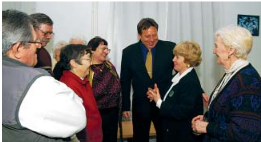
A fórum hivatalos része után még hosszan beszélgettek a résztvevők

Érdekes kérdések merültek fel a megjelent érdeklődők részéről. Ilyen volt például az az életből ismert helyzet, hogy vannak olyan házaspárok, akik egy lakásban élnek ugyan, ám megromlott a viszony közöttük. Valójában csak a közös lakás köti őket össze.