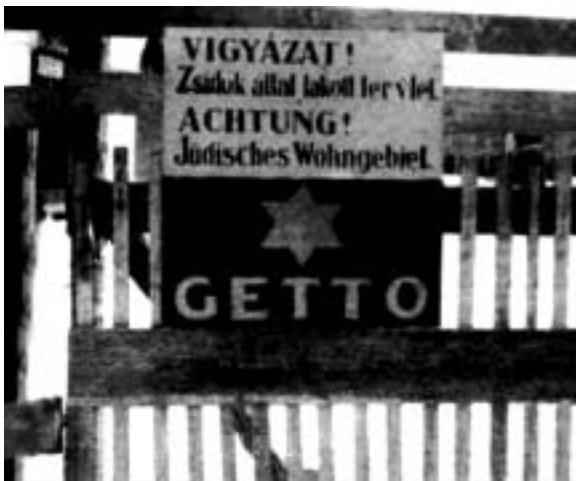
Több helyen a fenti, kétnyelvű tábla jelezte: a kapu mögött kezdődik a gettó

Bele estek a Dob, Wesselényi, Akácfa, Rumbach, Csányi, Holló és Kazinczy utcák, a saroktömbök kivételével, a Dohány utcából csak a zsinagóga. Magas deszkakerítésének, amelyet Auguszt József építési vállalkozása kezdett felállítani a Zsidó Tanács költségén, de jobbnak látta nem bevárni a szovjet hadsereget és Nyugatra ment - négy bejárata volt, amelyeket nyilasok és rendőrök őriztek, ők kísérték csoportokat a leendő gettőlakókat új lakhelyükre.