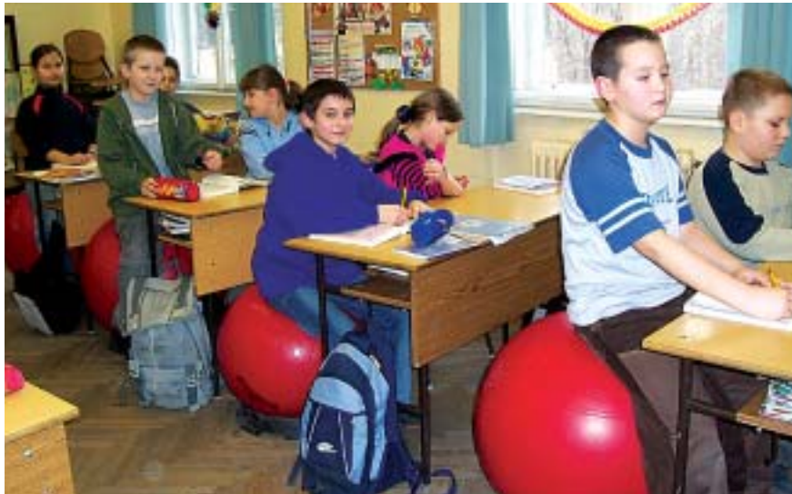
A gyerekek nagyon kényelmesnek találják az új „ülőalkalmatosságot”.

egy diák elfárad, azonnal széket kérhet. A gyermekek hamar megtanulták a labdák szabályszerű használatát, és nagyon kényelmesnek tartják azokat. Mivel az állandó