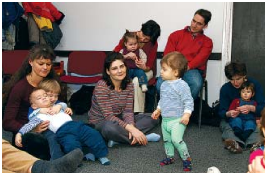
A Ringatót péntekenként rendezik meg az Almássy téri Szabadidőközpontban. Fotónk a február 4-ei rendezvényen készült.

Nem a kicsik tanításáról van szó, csupán egy olyan környezetet biztosítanak a gyerekek számára, ahol az elsődleges inger a zene, az élő énekszó. Ezt pedig a gyermek, a számára legfontosabb embertől, az édesanyjától kapja. Azonkívül, hogy fejlődik a kisgyermek valamennyi zenei képessége (ritmusérzék, zenei hallás, éneklési készség, zenei formaérzék, zenehallgatási készség), működik az úgynevezett zenei transzfer is. Vagyis a