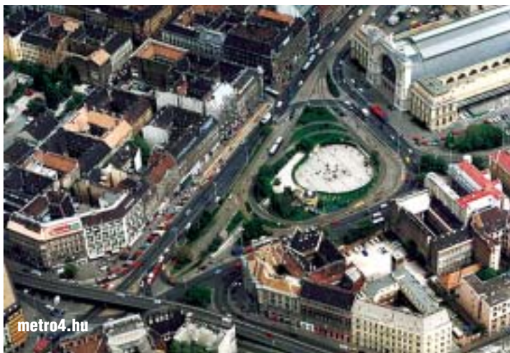
Légifelvétel - az eredeti állapotú Baross térről

Megértésüket és türelmüket köszönjük! BKV Rt.