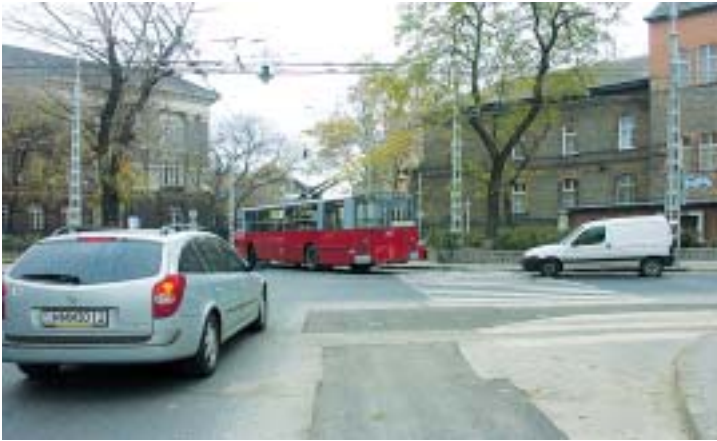
Némelyik kerületi útra bizony ráfér egy alapos felújítás

osztály és bizottság megkeresése után egy többéves felújítási tervben egyeztünk meg. Két dolgot tartottam fontosnak. Egyrészt, hogy azok a rossz állapotú, részben macskaköves